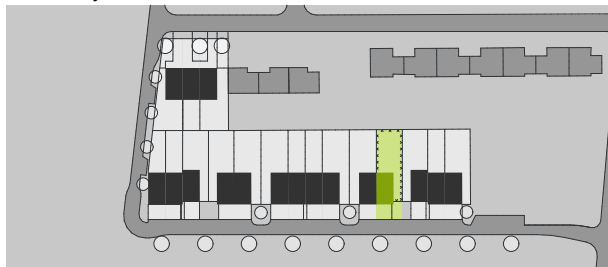
Pozice objektu v situaci